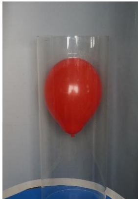
筒の中に空気が閉じ込められる