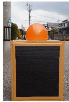
大型空気砲で風船を打ち出す