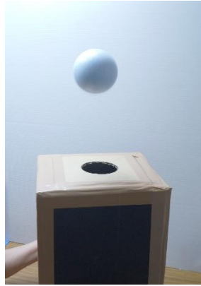
小型空気砲で球を打ち出す