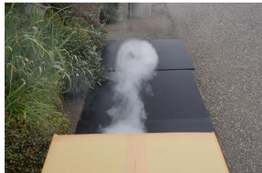
直径約30cmのうず状の煙の輪