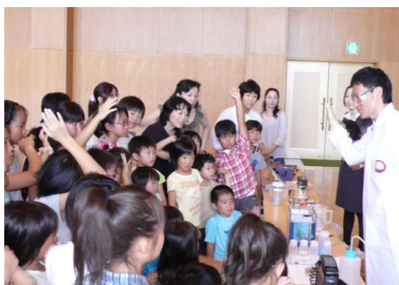
サイエンスショーの様子