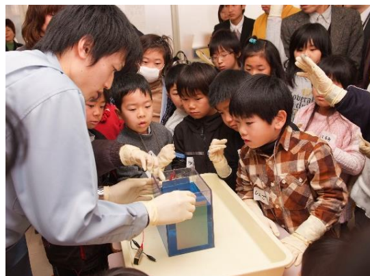
乾電池を用いためっき実験