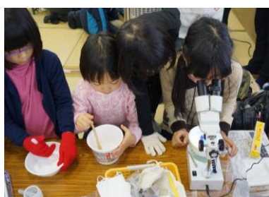
人工雪実験の様子