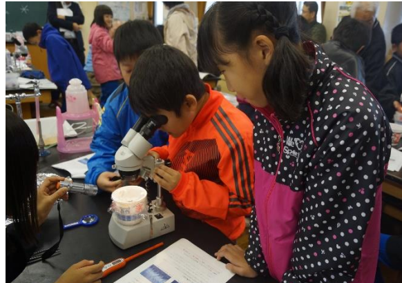
人工雪を観察する児童