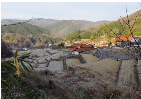
霜が降りた集落（霜の顕微鏡写真も展示）