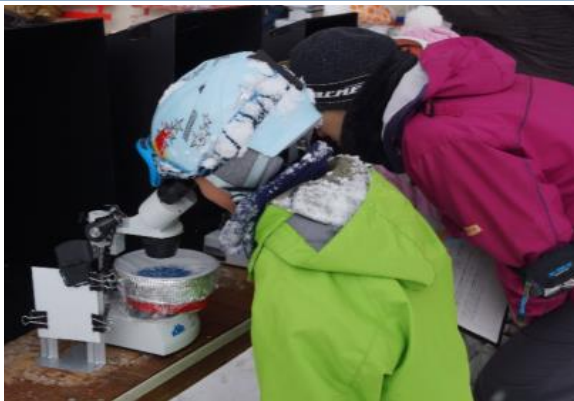
保存した雪を顕微鏡で見る児童

雪の結晶は美の象徴と言われるように、顕微鏡で雪の結晶を見ればだれでも感動します。しかし、観察中に雪が融けてしまうため、北海道以外では雪の結晶の顕微鏡観察は殆ど行われていません。我々NPOでは、ごく簡単な方法を用いて雪を融かさずに顕微鏡観察しています。これまで福井県奥越地方や安芸高田市高宮町野部で撮影した美しい雪の結晶写真を展示します。また、霜の顕微鏡写真や、人工雪の結晶の写真もあります。体験コーナーでは、北海道旭川市科学館から提供して頂いた“雪のレプリカ”を顕微鏡で見ることができます。