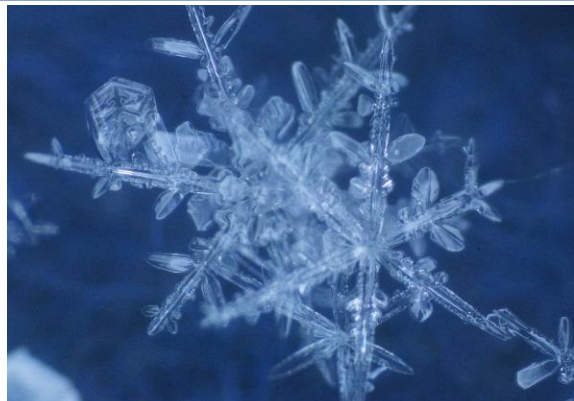
重なった2個の樹枝六花